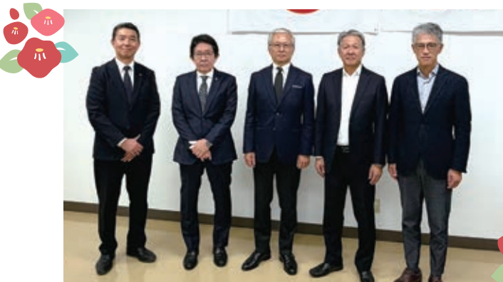
正副会頭・専務理事

づくりとして、事業継続力強化支援計画を基に企業の防災対策をはじめとするリスクマネジメント強化に向けた啓蒙活動を遂行し、対策実践へ機運を醸成し、地域全体の企業防災体制強化の実現を進め、市内事業所様の持続的な発展と地域発展の一翼を担う役割を果たしてまいります。 結びに、皆様方の益々のご健勝とご多幸を心より祈念いたしまして、年頭の挨拶とさせていただきます。