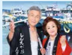
▲しんえがおスターズ