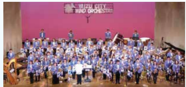
▲焼津市民吹奏楽団