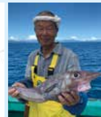
▲深海魚解体ショー