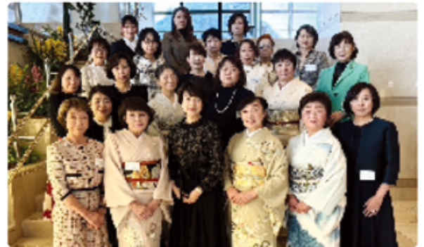
焼津商工会議所女性会創立20周年を迎えて