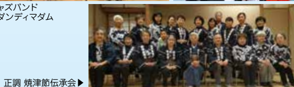
正調 焼津節伝承会▶