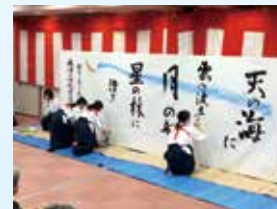
▲焼津高校書道部 シーガールズ