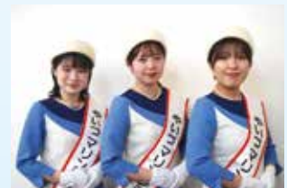
▲やいづマリンレディ