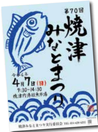
▲焼津高校書道部作成ポスター

・会員数／2,202会員（法人1,072 個人952 特別178）令和6年3月1日現在