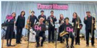
▲ジャズバンド ダンディマダム