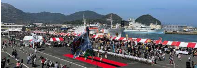
▲昨年の会場の様子