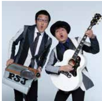
ワハハ本舗 ポカスカジャン