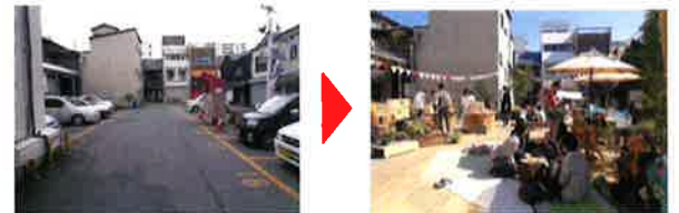
(福井県福井市・新栄商店街)