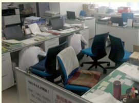
昨年の訓練の様子(当所)