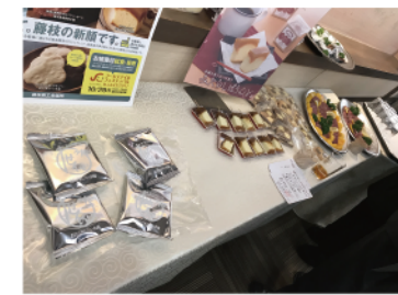
自社商品等PRコーナー