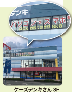
ケーズデンキさん 3F