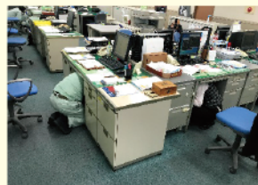
昨年の訓練の様子(株式会社磯工所)

シェイクアウト訓練とは、地震発生時に、机の下に入るなど、自分の身を守る安全確保行動(「まず低く、頭を守り、動かない」)の訓練です。