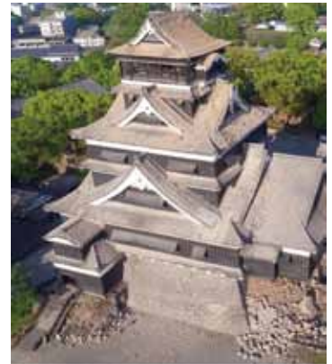
(写真：被災した熊本城)

そこで、熊本商工会議所では、この災害で被災した我が国の貴重な宝である熊本城の早期復元を支援することを目的としました、支援金の募集を行うこととしました。皆さまの温かいご支援を、何卒よろしくお願い致します。