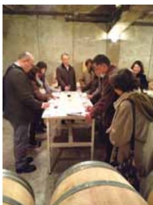
〈サドワイナリーにて〉

まず（公社）やまなし観光推進機構では山梨県の地方創生に向け「観光産業の活性化」「山梨の魅力の発掘と発信」「観光地域づくり」「地域産業の連携」の4つの基本方針に基づく取り組み事例について説明を受けました。次に（株）サドワイナリーにてコースランチをいただいた後、ワイナリーの見学では山梨での農場開拓の歴史・奥深いワインの知識やおしゃれなワインの楽しみ方を学び、試飲もさせていただきました。また信玄餅で有名な桔梗屋では工場見学に加え、思いがけず詰め放題の体験ができました。参加者からは観光と地域の活性化は繋がりがあ、商売に繋がる話が聴けてよかった、静岡県や焼津の良さを改めて感じたとの感想をいただきました。