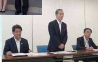
メディアに向けて相談状況を 情報発信する様子▶